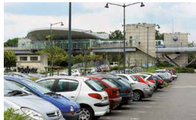
Les parcs-relais sont souvent gratuits pour les utilisateurs des transports collectifs et leur sont en général réservés.