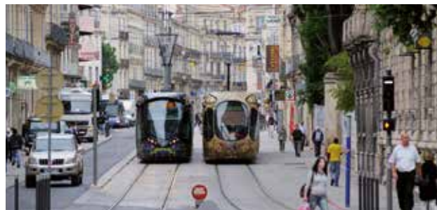
Savoir utiliser la diversité des modes de transport à notre disposition, c'est une des clés de notre liberté de déplacement.

Les transports évoluent, notre pratique des déplacements aussi. Pour faire le point, trouver de nouvelles idées et peut-être aller plus loin, pour présenter les pistes de la mobilité de demain, ce guide passe en revue nos modes de transport, compare leurs impacts sur notre vie et notre environnement et présente la diversité des solutions qui s'offrent ou s'offriront peut-être à nous dans un proche avenir, pour nous déplacer de façon plus durable et plus conviviale.