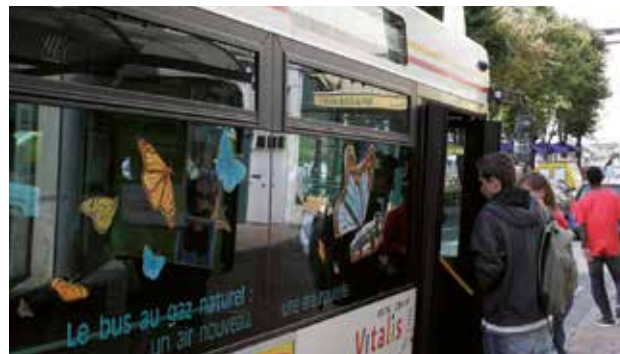
Un bus peut transporter en passagers l'équivalent de 40 à 50 voitures. Pour un même trajet, on consomme en bus 40% d'énergie en moins et on émet 35% de CO 2 en moins qu'en voiture.

En transports publics, la consommation d'énergie et les rejets de CO 2 par passager sont modestes. C'est encore plus vrai dans ceux qui fonctionnent au GNV (gaz naturel véhicule), aux biocarburants (diester, etc.), au GPL (gaz de pétrole liquéfié) ou à l'électricité.