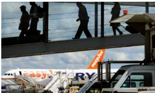
Les compagnies «low cost» ont largement contribué à la démocratisation des transports aériens.