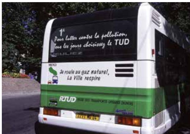
Le GNV alimente surtout des transports en commun et des véhicules utilitaires (bennes à ordures...).

Les moteurs au GPL et au GNV rejettent très peu d'oxydes d'azote (NOx) et pas de particules. Ils ne produisent pas ou produisent peu de polluants non réglementés toxiques, comparés à l'essence ou au gazole. Leurs rejets de CO 2 sont comparables à ceux des Diesel, à égalité de puissance moteur.