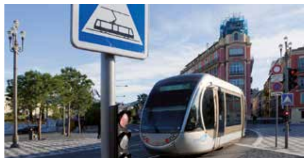
Une rame de tramway transporte à peu près l'équivalent en passagers de 170 voitures. Un passager du métro consomme environ 14 fois moins d'énergie qu'en utilisant sa voiture.

Les tramways et les métros sont très performants et offrent des avantages majeurs : ils ne polluent pas là où ils circulent et émettent peu de CO 2 . Dans certaines villes et à certaines heures, les vélos sont admis, avec une place dans des wagons dédiés.