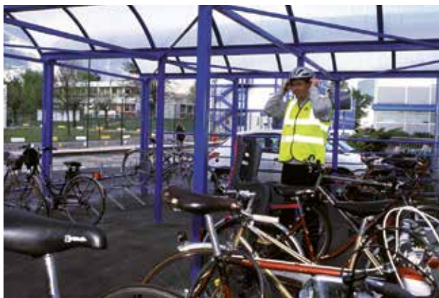
Un PDE est l'occasion de faciliter l'usage du vélo pour les déplacements domicile-travail.

Les plans de déplacements entreprise (PDE), inter-entreprises (PDIE) et les plans de déplacement des administrations (PDA) permettent à une (ou plusieurs) entreprise(s), une collectivité, un service public..., d'organiser et de rationaliser les trajets domicile-travail et les autres déplacements professionnels. Ils intéressent les salariés, mais aussi les fournisseurs, les clients, les stagiaires ou les visiteurs.