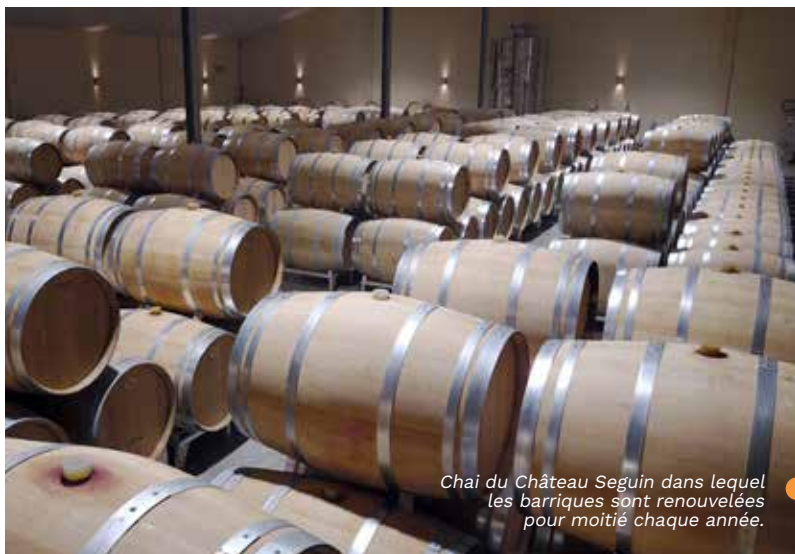
Chai du Château Seguin dans lequel les barriques sont renouvelées pour moitié chaque année.

Si Canéjan est connue pour son cadre verdoyant, elle l'est aussi pour ses composantes viticoles ! Elle accueille sur son territoire deux châteaux en appellation Pessac-Léognan : le Château Seguin et le Château de Rouillac.